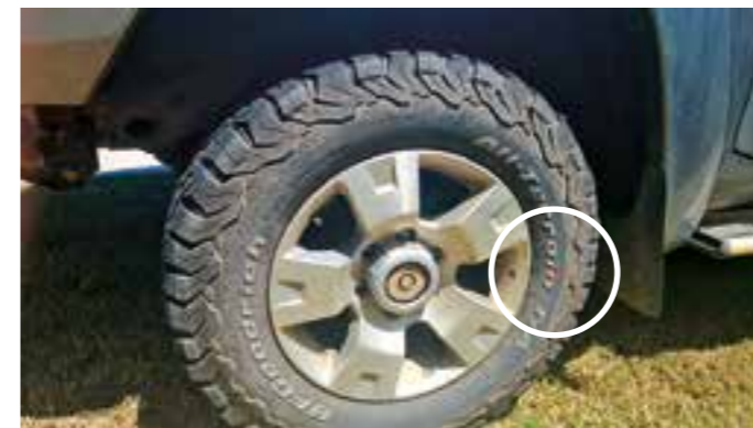
På dette dekket er datostemplingen ved rød pil.