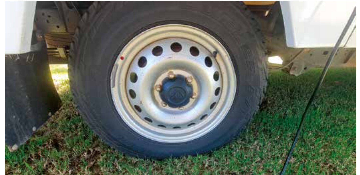
Datostempling på dekkene er ofte bare på en side. På dette dekket er datostempling av dekket på innsiden.

Benyttes vinterdekk i perioden for sommerdekk, er 1,6 mm minste mønsterdybde. For å bruke vinterdekk i