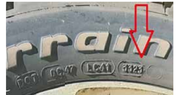
De 4 sifrene her angir datomerkingen. Finner man ofte ved DOT merkingen og det ser ut som de er svidd inn i dekket og ikke støpt som annen merking. Tallene her er 3323 og det betyr at dekket ble produsert i uke 33 i 2023.

sommerperioden, må dekket minst ha hastighetsmerkingen oppgitt i vognkortet. Da gjelder ikke unntaket med hastighetsindeks Q, 160km/t